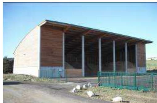
Hangar de la commune de Saugues

La déchetuse est alimentée en perches à l'aide de la grue. Les plaquettes sont directement éjectées dans une remorque agricole ou dans le hangar de la plateforme. La déchetuse permet de broyer des bois jusqu'à 40 cm de diamètre.