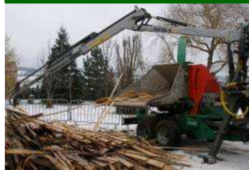
Déchetage de dosses