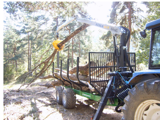
Remorque forestière de la CUMA

La déchiqueteuse est alimentée en perches à l'aide de la grue. Les plaquettes sont directement éjectées dans une remorque ou dans le silo de la chaufferie. La déchiqueteuse permet de broyer des bois de 10 à 35 cm de diamètre.