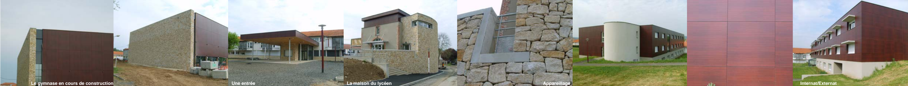
Le gymnase en cours de construction