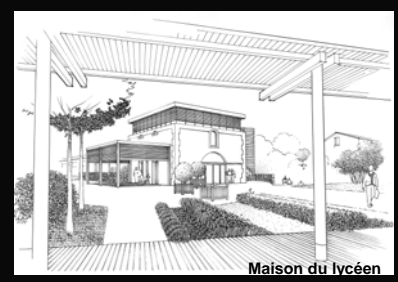
Maison du lycéen

La rénovation projetée du lycée de Bonnefont, a pour objectif l'extension d'un bâti existant devenu trop exigu et ne répondant plus à une demande croissante de formations. Parmi les diverses interventions, citons le prolongement de l'internat/externat, la création d'un gymnase/vestiaires et d'un aménagement paysager des abords.