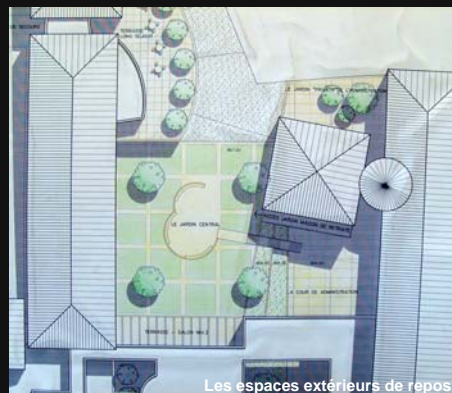
Les espaces extérieurs de repos